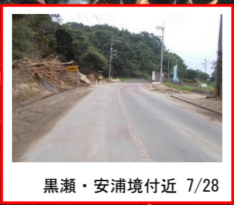
黒瀬・安浦境付近 7/28