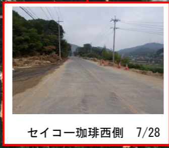
セイコー珈琲西側 7/28