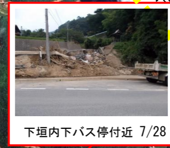
下垣内下バス停付近 7/28