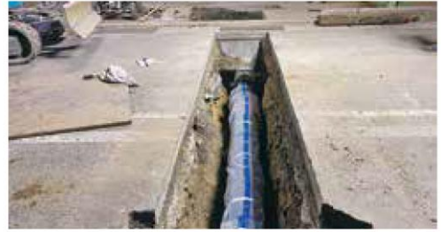
水道管取り替え工事の様子

水道管の工事の際には、付近で交通規制や断水になることがあります。ご迷惑をお掛けしますが、ご協力をお願いします。