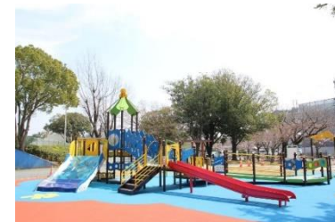
インクルーシブ遊具の例

様々な利用者の思いを包含することで、障がいなどを理由に利用をためらうことなく、誰もが一緒に楽しく遊べるよう、バリアフリー化を進めるとともに、インクルーシブ*な視点に立った取組を進めます。