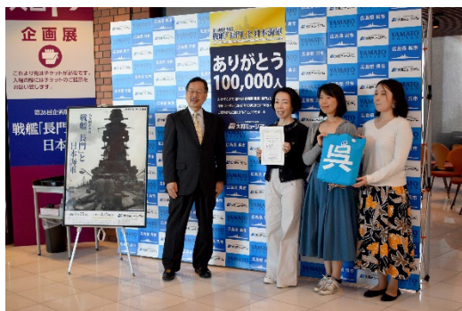
第26回企画展10万人式典