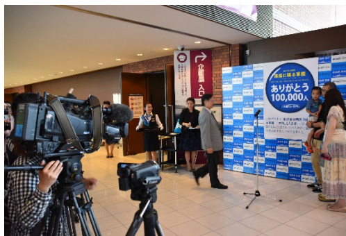
第27回企画展10万人式典