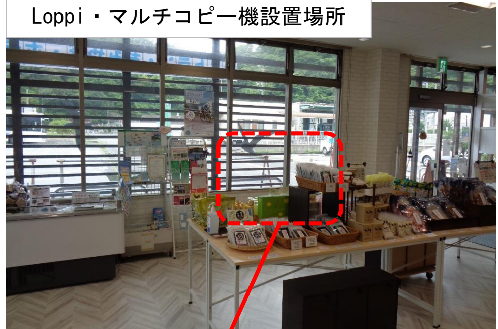
Loppi・マルチコピー機設置場所