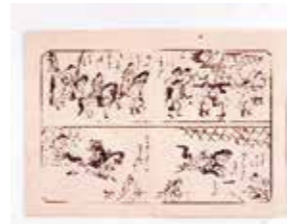
▲「宝永華洛細見図 第十巻」 宝永年間(1704-11)