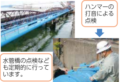
ハンマーの打音による点検

事故発生時の影響が大きいと想定される重要な水道管路は、漏水が無いかな、日頃から点検を行っています。異常や漏水を発見した時は、速やかに修繕を行います。