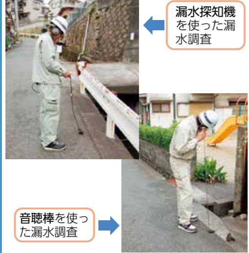
漏水探知機を使った漏水調査