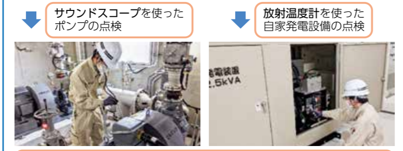
サウンドスコープを使ったポンプの点検