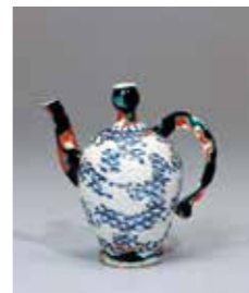
▲「色絵波鶴文水注」 1660-90年代