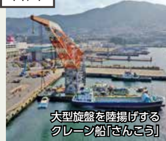
大型旋盤を陸揚げするクレーン船「さんこう」