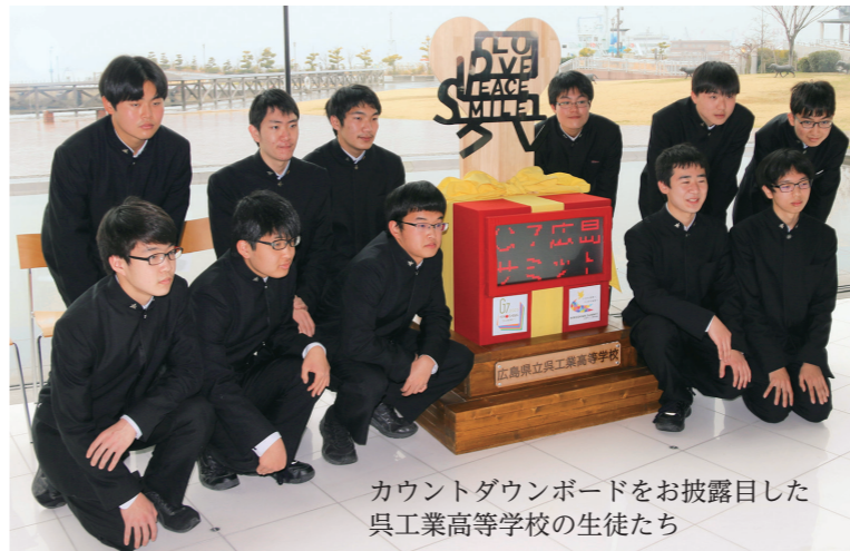
カウントダウンボードをお披露目した呉工業高等学校の生徒たち