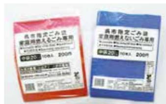
▲平袋式指定ごみ袋のサンプル品

今回の変更による価格・枚数・色についての変更はありません。従来品の在庫が無くなり次第、順次、店頭に並ぶ予定です。従来品も引き続き使用できます。