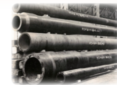
▲呉海軍工廠で、大型旋盤によって加工された砲身