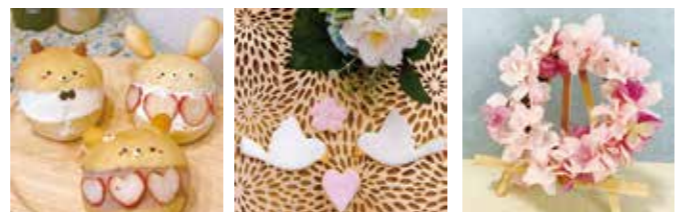
▲パン ▲アイシングクッキー ▲フラワーアレンジメント

●パン ～動物マリトッツォ作り～ 対象 年少以上(小学2年生以下は保護者同伴) 日時 3/28(火)10:00～12:00 定員 12人(先着) 料金 1,000円 ●アイシングクッキー 対象 年少以上(小学2年生以下は保護者同伴) 日時 3/28(火)13:30～15:30 定員 10人(先着) 料金 900円 ●フラワーアレンジメント～フラワーリース作り～ 対象 年少以上(小学3年生以下は保護者同伴) 日時 4/1(土)10:00～12:00 定員 10人(先着) 料金 1,200円 いづれも 場所 警固屋まちづくりセンター 申込 3/20(月)から直接同センター窓口で