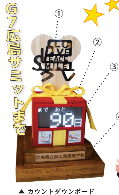
▲ カウントダウンボード

呉工業高等学校の生徒が、G7 広島サミット開催に向けたカウントダウンボードを製作しました。開催90日前の2/18(土)には、大和ミュージアムで除幕式が行われ、カウントダウンボードが大和ミュージアムエントランスに設置されました。広島を世界に広く発信できるサミットの開催。「オール広島」で盛り上がっていきましょう。