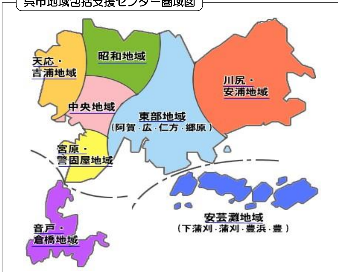
呉市地域包括支援センター圏域図