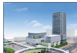
選定された事業協力者の提案イメージ (呉駅周辺地域総合開発)