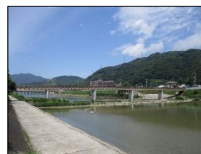
橋の復旧工事(真光寺橋)