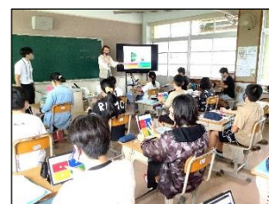
タブレットを活用した授業の様子