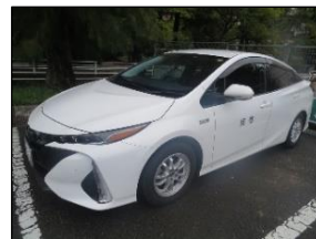
PHV(プラグインハイブリッド)車の導入