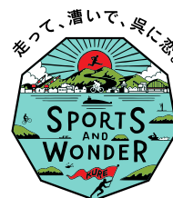
呉・瀬戸内ブランディング 推進事業のロゴマーク