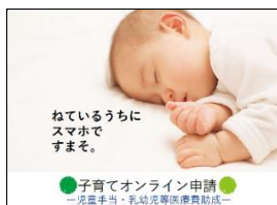
子育てオンライン申請 一児童手当・乳幼児等医療費助成 オンライン申請のチラシ