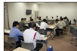
支援調整会議の様子 (自立相談支援事業)