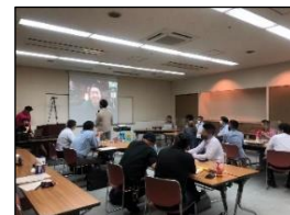
人材育成塾の様子