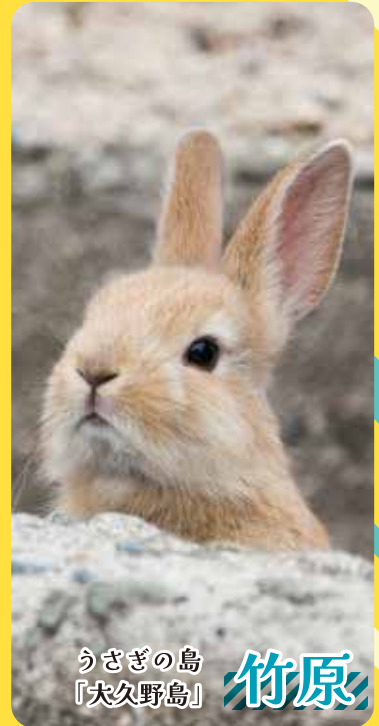
うさぎの島 「犬久野島」 竹原