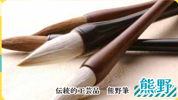
伝統的工芸品 熊野筆 熊野