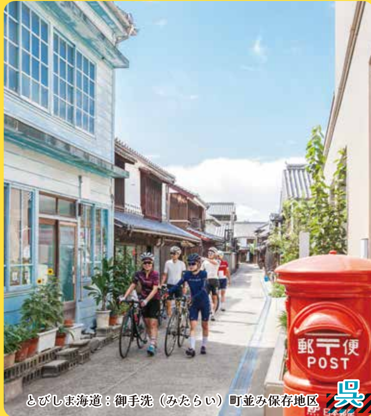
とびしま海道：御手洗 (みたらい) 町並み保存地区 呉