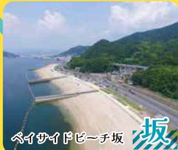
ベイサイドビーチ坂 坂