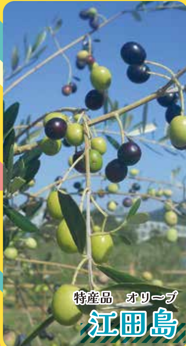
特産品 オリーブ 江田島