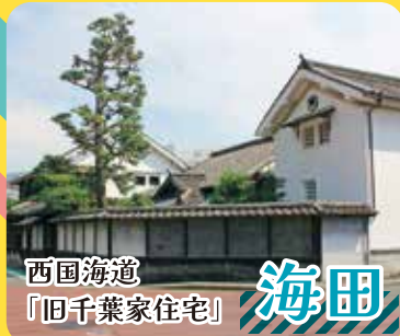
西国海道 「旧千葉家住宅」 海田