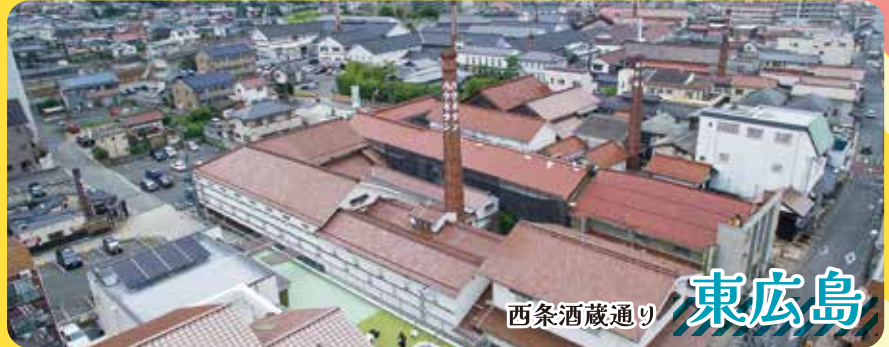
西条酒蔵通り 東広島