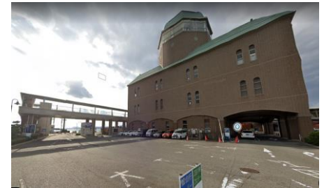
呉中央棧橋ターミナル

老朽化が著しい広ふ頭の岸壁エプロン部について、国直轄事業と併せて舗装の改修を実施