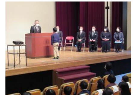
第31回人権啓発ポスター ・絵画展 表彰式

人権研修や講演会、児童・生徒の「人権啓発ポスター・絵画展」の開催、隣保館等での相談事業、啓発広報活動の実施