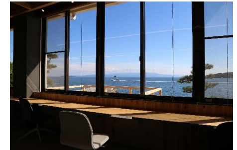
梶ヶ浜コワーキングスペース

企業等が工場等を新設・増設した場合、呉市企業立地条例に基づき設備の取得費等の一部を助成