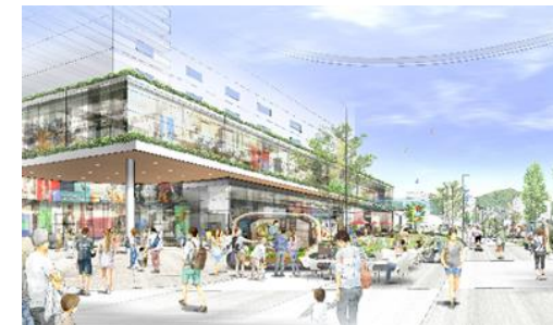
呉駅周辺地域総合開発 の整備イメージ

大地震等の災害時に滑動崩落による被害が発生する可能性がある大規模盛土造成地の安全・安心を確保するため，危険性を調査(令和4年度:2箇所)