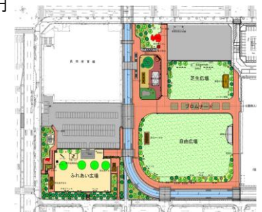
中央公園整備イメージ

安全・安心な公園遊具の保全を図るため，老朽化した遊具の更新や危険な遊具の改修を実施 令和4年度：改修工事（9公園）等