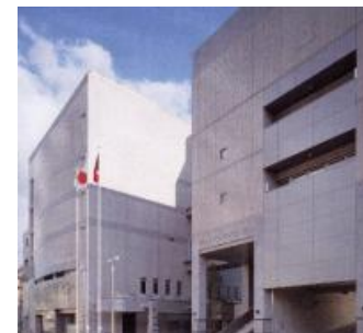
川尻まちづくりセンター