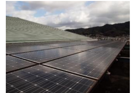
市役所屋上太陽光パネル

社会環境などの変化から承継者を必要としないなど, 市民ニーズに対応した墓地施設である合葬式墓地の管理運営（令和4年4月供用開始）