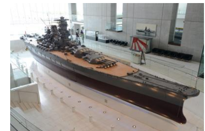
大和ミュージアム

安芸灘地域へ観光客を呼び込むため、安芸灘大橋を現金で通行し、指定施設(79施設)で1,000円以上買い物した場合に、帰りの安芸灘大橋有料道路回数通行券を交付等