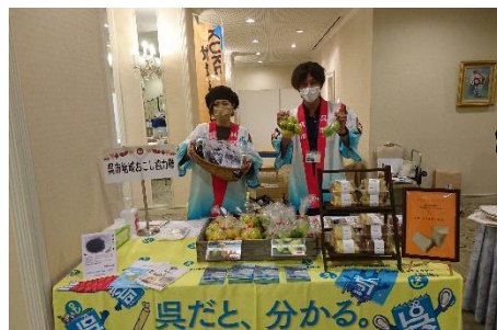
地域おこし協力隊

安芸灘地域に居住する子育て世帯（18歳以下の子供がいる家庭）を対象に、安芸灘大橋有料道路回数通行券綴1冊につき1万円を助成（上限：子供1人目：3冊/年，2人目以降：1冊/年）