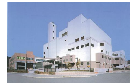
クリーンセンターくれ

し尿処理施設等（6箇所）の段階的統合や, 将来にわたって安定的・効率的にし尿処理を実施するため, し尿等前処理施設を広多賀谷の東部処理場内に建設 令和4年度：前処理施設の建設工事（令和5年度完成予定）, 総事業費：26.8億円