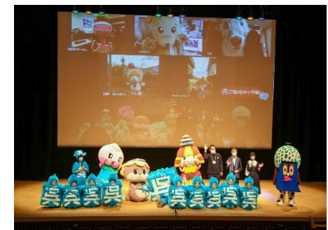
第3回復興キャラ祭 令和3年12月5日 新日本造機ホール