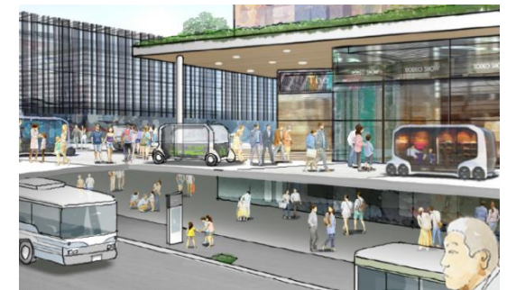
次世代モビリティの導入イメージ