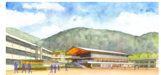
(仮称)天応義務教育学校(イメージ図)

障害のある児童・生徒にきめ細やかな指導を実施 指導員(52名), 指導補助員(58名)