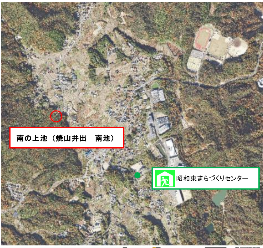
南の上池（焼山井出 南池）