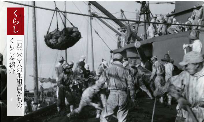
「伊勢」の石炭積込作業