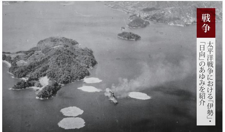
呉で空襲をうける「日向」