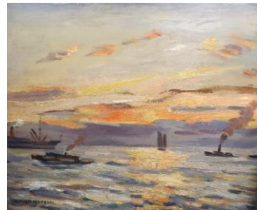
1 《風景》制作年不詳 個人蔵

個人コレクションは、公共のコレクションとは異なり、公開を前提としていないため、目にする機会はあまり多くありません。コレクターの興味や関心によってのみ収集されるこれらのコレクションは、その審美眼によって選び抜かれた作品の「こだわり」や「かたより」があり、それがまた魅力となっています。本展では、南薫造作品のコレクターのご協力を得て、記念館のコレクションとともに「外国風景から瀬戸内へ」、「人物表現と肖像画」、「花の表現 油彩と水彩」という3つのテーマでご紹介します。個人コレクションと記念館のコレクションのコラボレーションによって生み出される、南薫造の新たな魅力をお楽しみください。