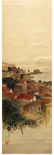
3 《伊太利亚ナポリ之記念》1909年頃 個人蔵

小企画① 南薫造と星野別荘 (開催中) -12月20日(月) 南一家が毎年夏を過ごした星野別荘に関連する資料を展示します。 南薫造と旅 -ガイドブックから名所案内まで- 12月22日(水)-2022年6月20日(月) 南が旅先で収集した観光パンフレットや地図、名所案内等を展示します。