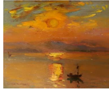
2 《瀬戸内海旭日》制作年不詳 個人蔵