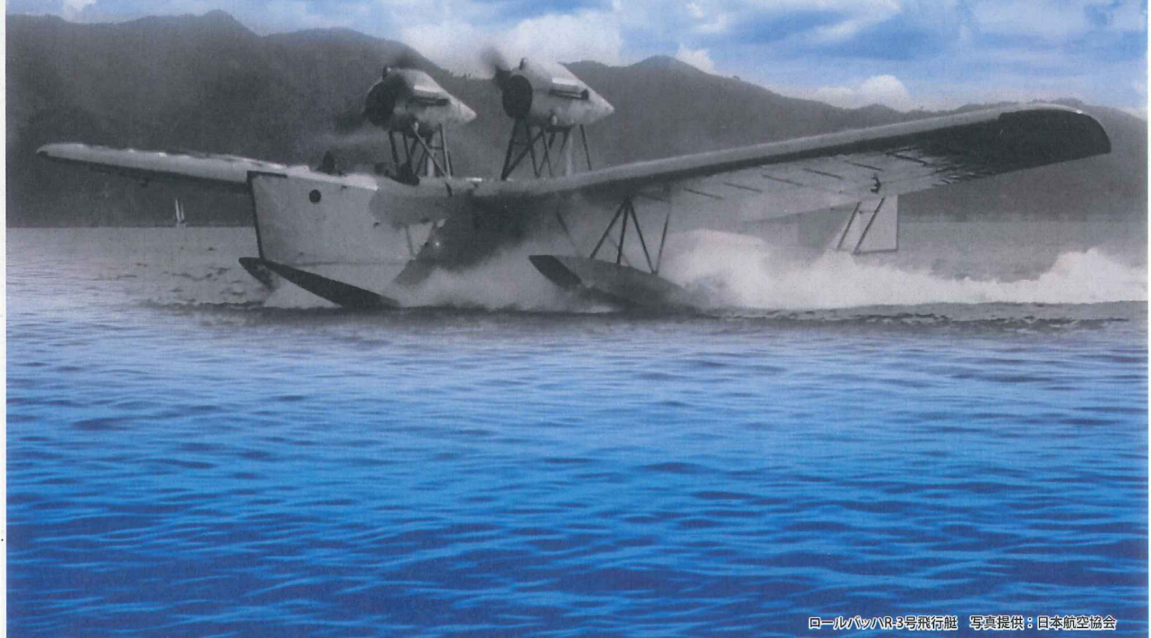
回＝ルバツ/R-3号飛行艇

開館時間 9:00～18:00 (入場は17:30まで) 会場 大和ミュージアム1階 大和ホール 休館日 火曜日(祝日の場合は翌日) 4/29～5/5の間は無休