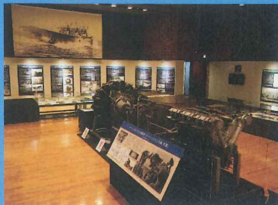
▲ 企画展展示室内の様子