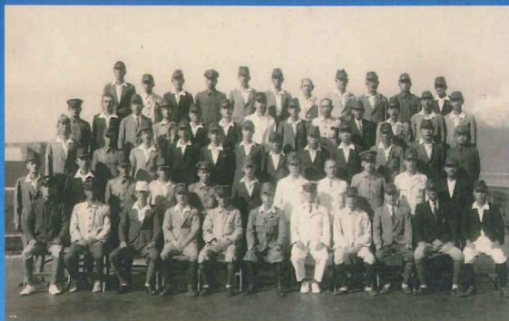
▲ 十一空廠飛行機部の集合写真(昭和19年)