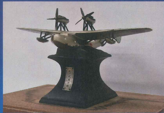
▲ 九一式飛行艇模型 (高松宮家への献上品)