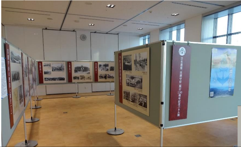
呉市役所 1階多目的室 令和元年8月27日(火)～9月12日(木)