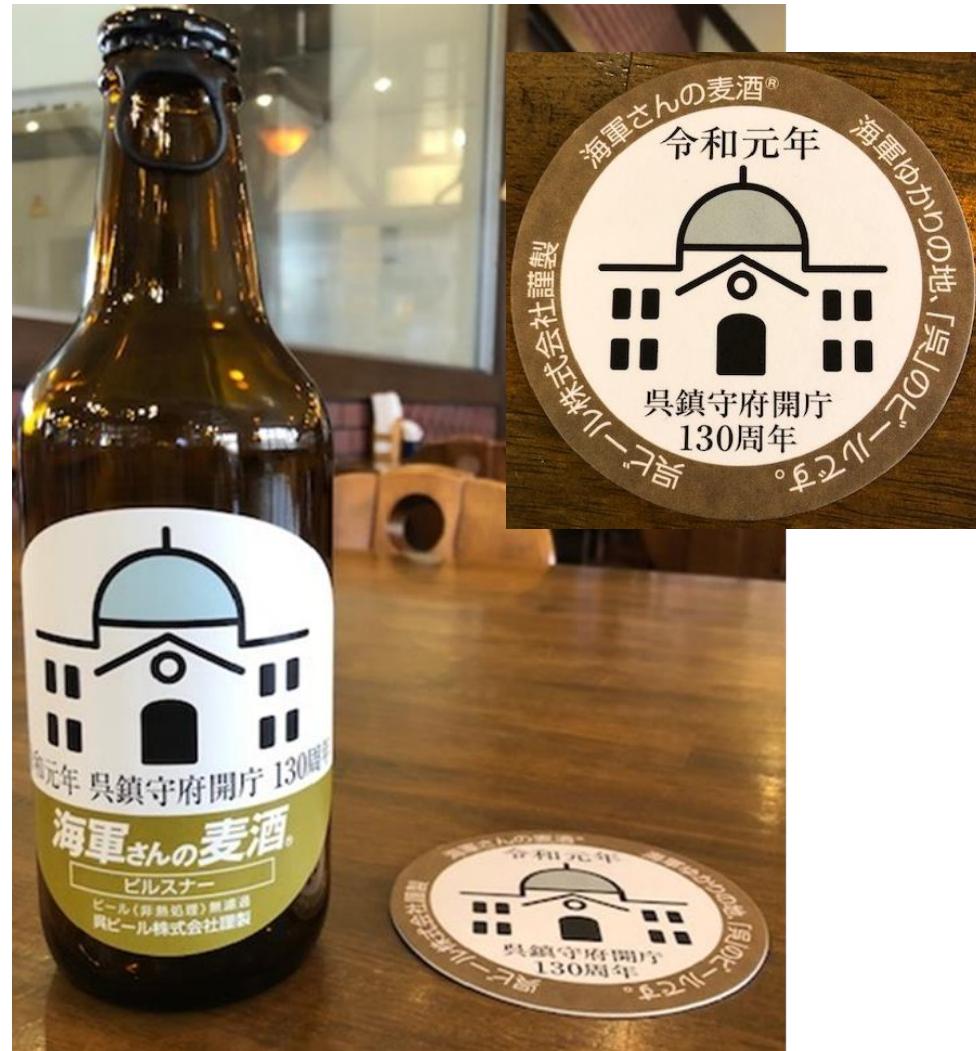
呉ビール株式会社 地ビール及びコースター