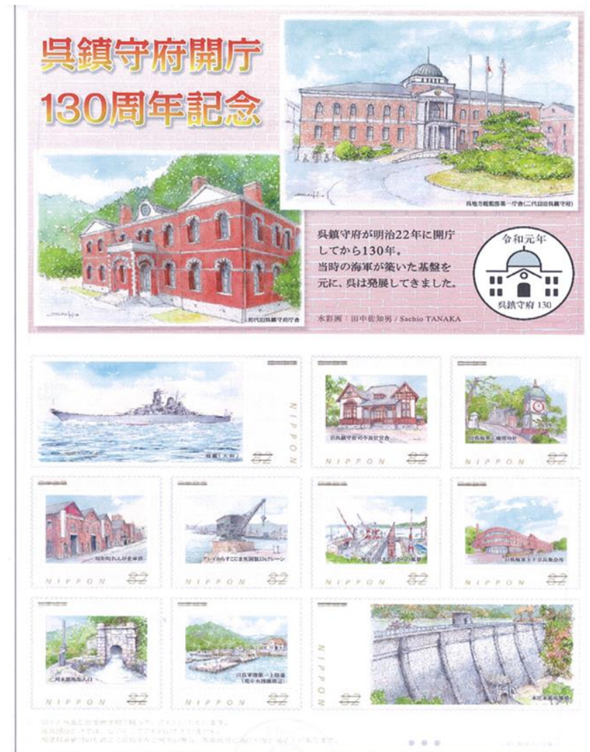
呉宮原三郵便局 記念切手フレーム