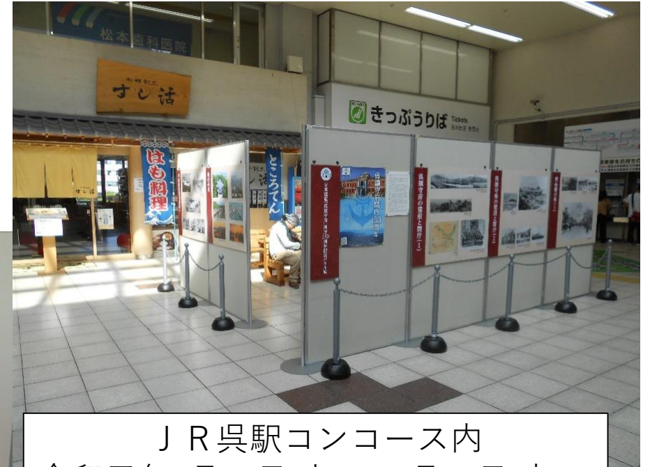
J R 呉駅コンコース内 令和元年9月14日(土)～9月26日(木)

呉鎮守府の歴史を当時の写真と解説で紹介するパネル展を呉市役所 1階多目的室ほか 3カ所で開催しました。