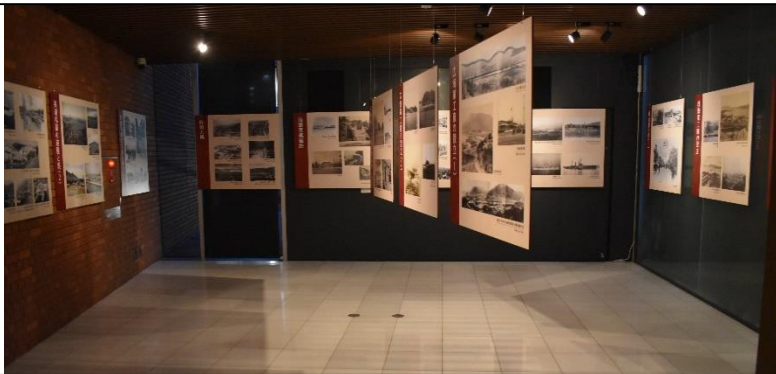
大和ミュージアム 令和2年1月28日(火)～2月20日(木)