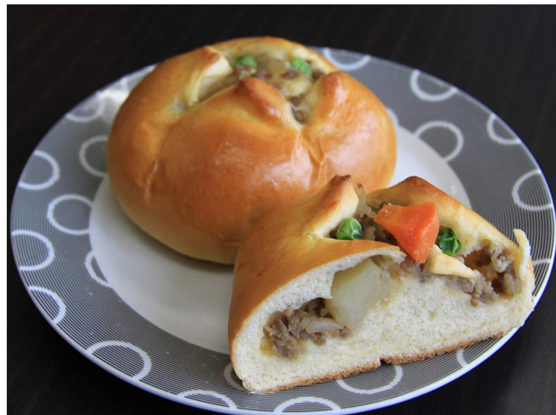
社会福祉法人かしの木 呉鎮守府クッキー及び肉じゃがパン