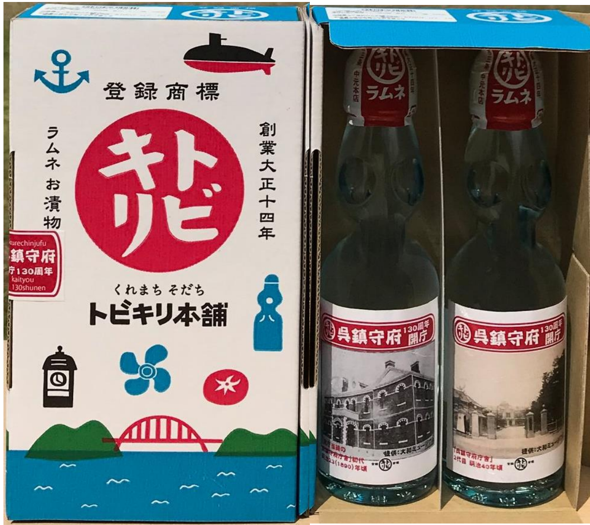
株式会社中元本店 ラムネ