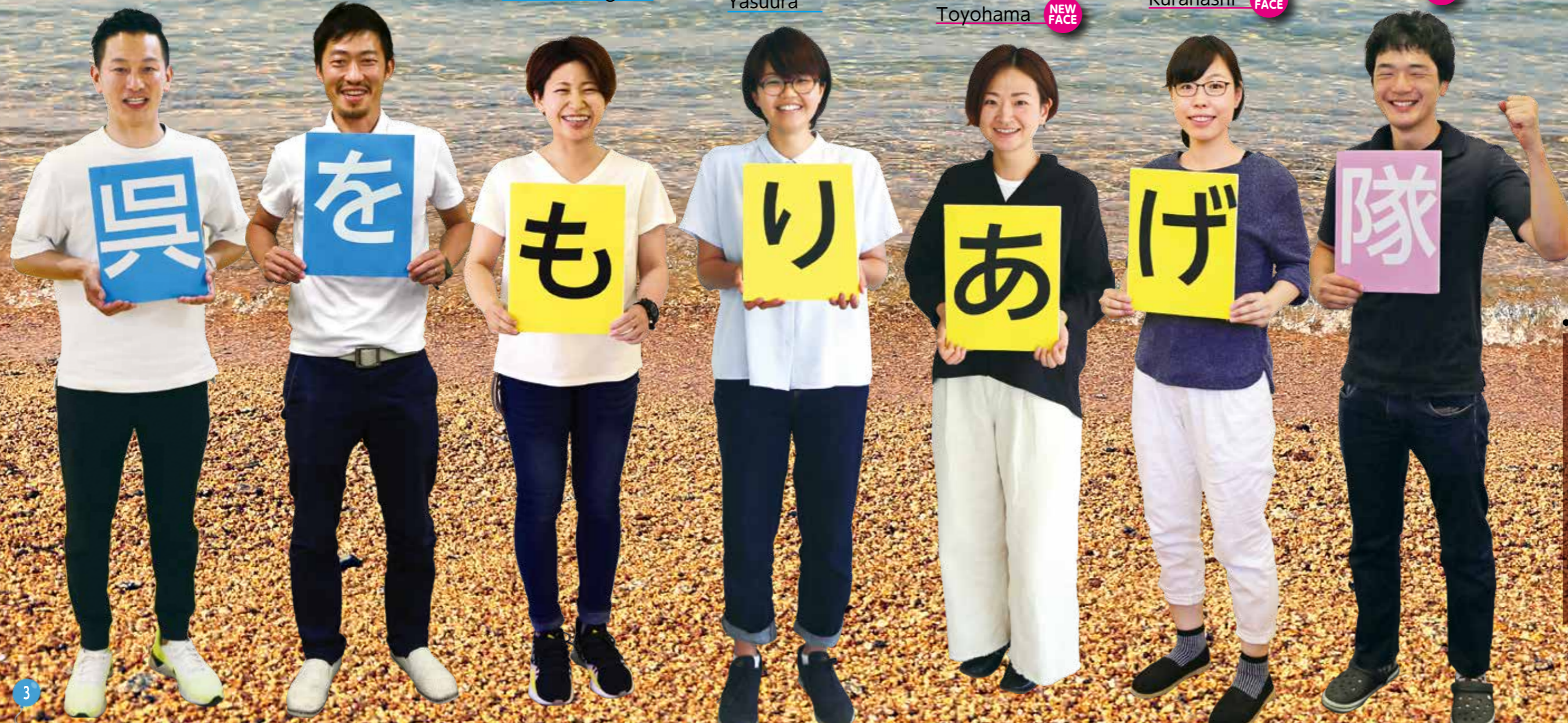
Ondo NEW FACE