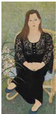
▲益井三重子《レースのひと》1973年

昨年度の新収蔵作品を含め、呉市出身の日本画家・益井三重子の画業を紹介します。期間 8/23(日)まで