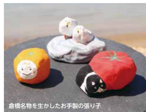
倉橋名物を生かしたお手製の張り子

実は移住してきて早々、ヘルニアの手術の為に入院生活を送ることになりました。そんな私に、地域の方から多くの支援や優しさをいただきました。情けなく申し訳ない気持ちでしたが、とてもありがたかったです。おかげで順調に回復し、今度は私が恩返しをする番です。多くの人に島の楽しさを感じてもらえるように頑張ります！