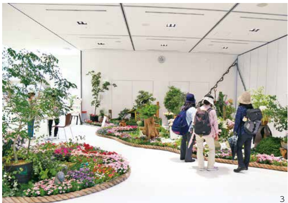
1 限られた時間のなかでの部活動 2 新しい入館方式で大和ミュージアム再開(6/3) 3 市役所に癒やしの空間。美しい花々で心も癒された“呉の夏は花ざかり展”(6/26・27)

資源集団回収団体報償金の申請受け付け 環境政策課 ☎25-13304 上半期分(1月～6月)の報償金を交付します。 対象 上半期に呉資源集団回収協同組合加入業者を通じて回収した団体 申請 8月3日(月)～31日(月)に、環境政策課または各市民センターへ エアポートバス「呉広島空港線」の運行ダイヤ 交通政策課 ☎25-13239 新型コロナウイルスの感染拡大防止のため、広島空港を発着する航空機の運航便数に変更があることから、「呉広島空港線」は6月15日から臨時ダイヤで運行しています。臨時ダイヤによる運行期間は、現在未定ですが、今後変更があるときは、Q市ホームページなどに掲載しますので、事前に確認して利用してください。 7月31日まで バスの車内事故防止キャンペーン 交通政策課 ☎25-13239 広島電鉄 ☎36-12460 走行中に席を離れると、転倒など思わぬけがをする場合があります。