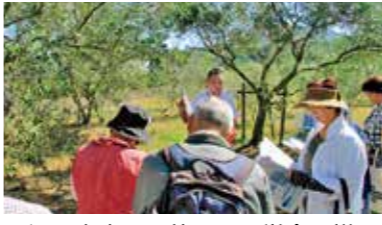
▲江田島市で開催した見学会の様子

助成内容 ●苗木 3年生の苗木を1本870円で販売 ●遊休農地再生 草刈り・拔根・整地・土壌改良などに要する経費の2分の1以内。対象経費は10万円当たり15万円まで(上限30万円) 申込 12月27日(水)までに電話で