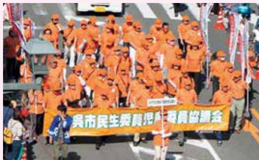
▲呉みなと祭でのパレード