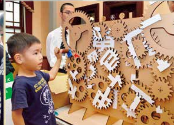
呉の歴史の森フェスタ 10/7・8 (入船山記念館) 開館50年を記念したイベント。記念館初のライトアップや呉高専学生によるワークショップなどで盛りだくさんな2日間でした。