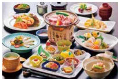
▲プレミアムコース

グリーンピアせとうち ☎84-0262 ※駐車料金は無料です。 冬の瀬戸内海の恵みをふんだんに使った自慢の本格会席に飲み放題(2時間)がセットになったプランを、呉市民を対象に優待価格で提供します。 期間 12/1(金)~来年1/31(水) 特典 ●お湯都びあ入浴サービス(タオル付) ●15人以上の利用で幹事1人分無料 ●15人以上の利用で無料送迎 料金 プレミアムコース 6,900円 ゴールドコース 5,900円、 プラチナコース 4,900円