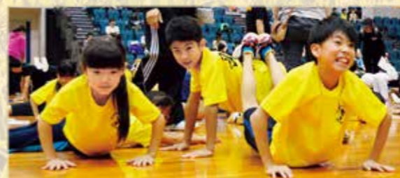
市民体カテスト会 10/9 (オークアリーナ) 体育の日に行われた恒例イベント。腕立て伏せや、5分間走などで自分の今を確かめました。