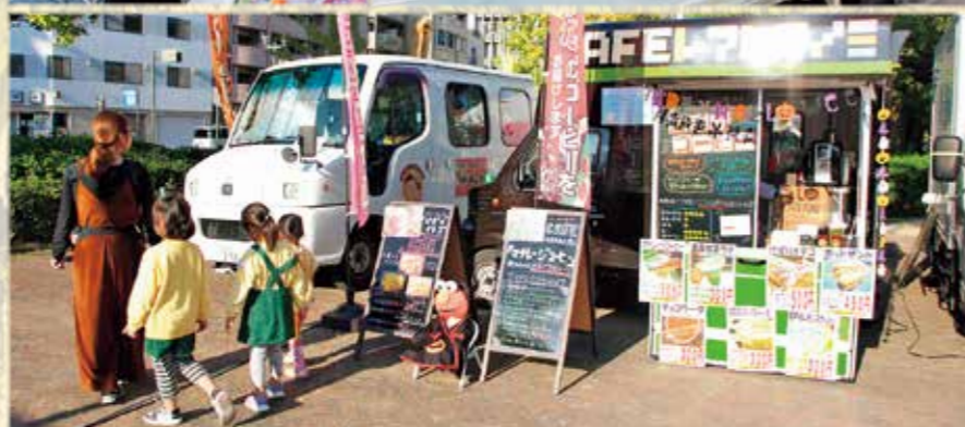
憩いの場 KURE TERIA 10/27 (楓橋周辺) 「誰もが集い、憩え、楽しめる」をテーマに楓橋周辺にオープンした移動式店舗、その名も KURE TERIA (クレテリア)。来年1月12日まで出店を予定しています。毎週金曜の夕方は一斉出店日でオススメです！