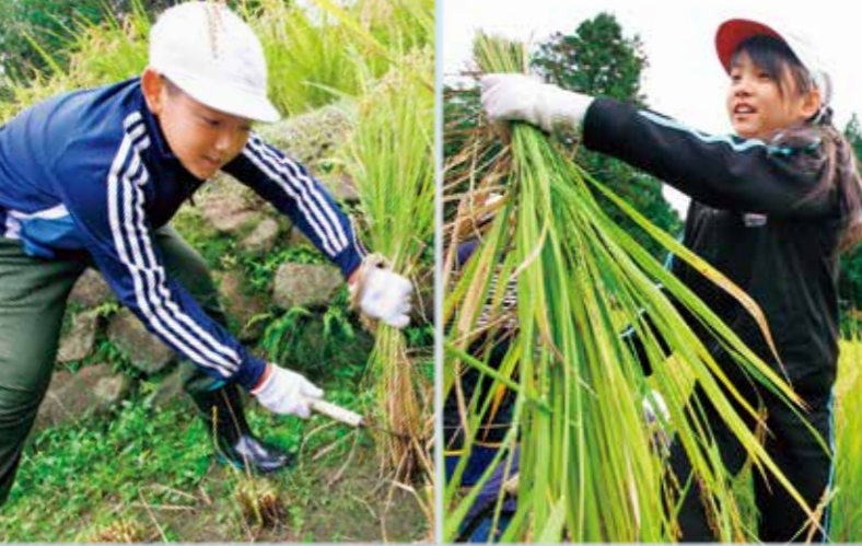
農業体験 10/13 (郷原町) 天応小の児童たちが稲穂の収穫を体験。稲作の現場で米作りを学びました。