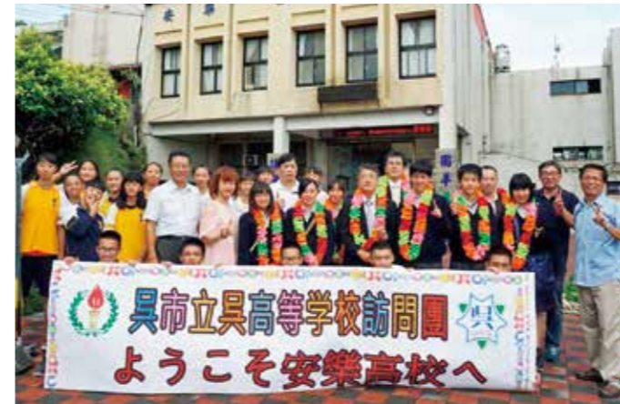
◆ 校門の前で歓迎を受けました