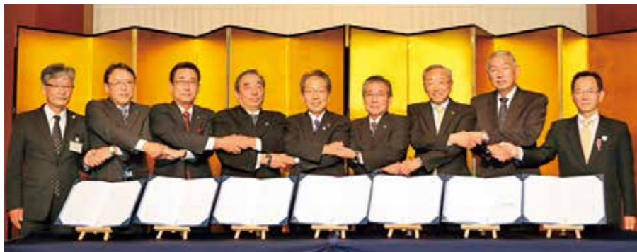
▲左から 広島県地域振興部長、坂町副町長、海田町長、東広島市長、呉市長、竹原市長、江田島市長、熊野町長、大崎上島町長

10月16日に、近隣の3市4町（竹原市・東広島市・江田島市・海田町・熊野町・坂町・大崎上島町）と「広島中央地域連携中枢都市圏」を形成するための連携協約を締結しました。 人口減少・少子高齢社会にあっても、活力ある社会経済を維持するため、「経済成長のけん引」、「高次の都市機能の集積・強化」、「生活関連機能サービスの向上」に係る事業を来年度から実施していきます。