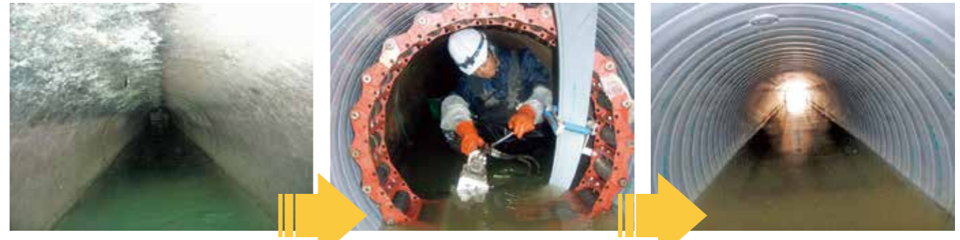
工事前の下水道管