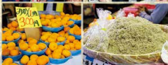
呉市場祭り 10/29 (地方卸売市場) 普段実際に使用されているせり場での青果物の模擬せり。参加した子どもたちも大興奮！自分でせり落とした野菜を前に大満足の様子でした。