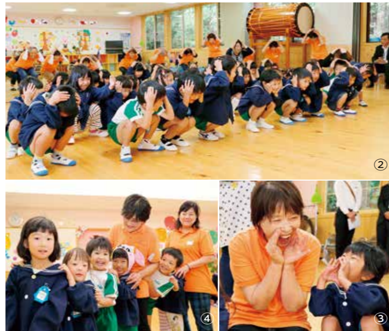
①昭和幼稚園・昭和保育園の子どもたちと、第21・19区の民生委員の皆さん ②「地震が来たら？」しゃがんで頭を守るダック（あひる）のポーズ ③④一緒に学んでいるうちに距離が縮まり、自然と笑顔が増えていく

子どもたちはリラックスモード。ゲームを通してさらに距離は縮まり、学びだけではなく、地域の人とともに楽しい時間を過ごすことができるのも、この取り組みの魅力の一つです。 「いっしょに遊ぼう！」 「もっとおしゃべりしたい！」 ゲームを終えても、子どもたちに囲まれている民生委員の皆さんの姿は、「地域で愛されるマンパワー」そのものでした。