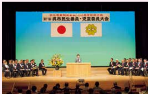
▲民生委員制度創設100周年記念大会

新たな100年に向けて、身近な「心のよりどころ」である民生委員制度を次の世代にしっかりと引き継ぎ、呉市の福祉の向上を図っていきます。