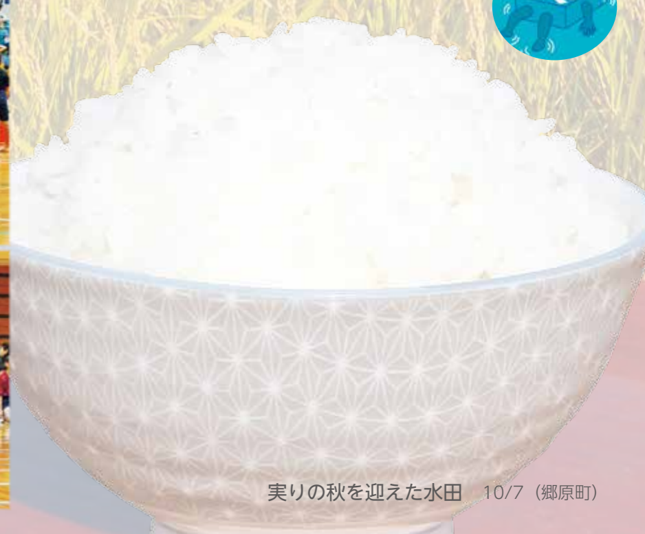
実りの秋を迎えた水田 10/7 (郷原町)