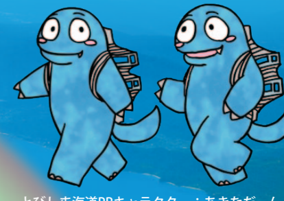
とびしま海道PRキャラクター：あきなだん