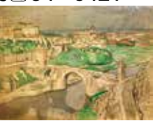
▲渡辺武夫 《モレーの午後》

南薫造記念館 特別展 南薫造と東京美術学校の生徒たち ☎84-6421 南薫造と、その生徒たちの作品を一堂に展示し、師弟の温かな交流とその多彩な魅力を紹介します。 期間 12/15(日)まで9:00～16:30 [火曜休館。10/22(水)は開館。23(水)は休館] 料金 一般 150円(120円) 高校生 90円(70円) 小・中学生 60円(40円) ※()は20人以上の団体。市在住・在学の高校生以下は無料。 ●小企画 絵はがきで見る 南薫造の画業—新文展・日展編— 南薫造が出品し受賞を重ねた官展から、新文展・日展の出品作を絵はがきでたどりませ。 期間 10/2(水)～来年1/6(月) ※入館料のみで見学できます。