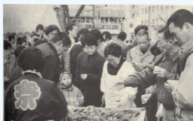
第1回かき祭り (2月号) 蔵本通りのこもれび広場で殻付きカキの試食や即売コーナーなどが人気