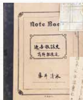
▲大学時代の講義ノート 「近世歌謡史 高野教授述」の表紙を めくると板書がぎっしり