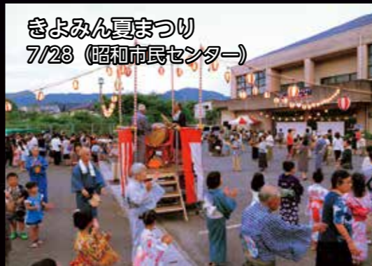
きよみん夏まつり 7/28 (昭和市民センター)

※デジタルブック(電子書籍)版で画像をタップすると別の画像を見ることができます。