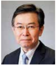
観光庁長官 田端 浩

文化振興課 ☎ 25-3462 開庁130周年を記念して、観光庁長官による講演会と鎮守府開庁後の呉の歴史を振り返り、街の記憶を未来へ伝えるパネルディスカッションを開催します。 日時 10/4(金)13:00開場 内容 ●基調講演(14:00~15:00) 演題 観光立国を目指して ~地方都市におけるインバウンド政策~ 講師 観光庁長官 田端 浩さん ●パネルディスカッション(15:10~16:40)