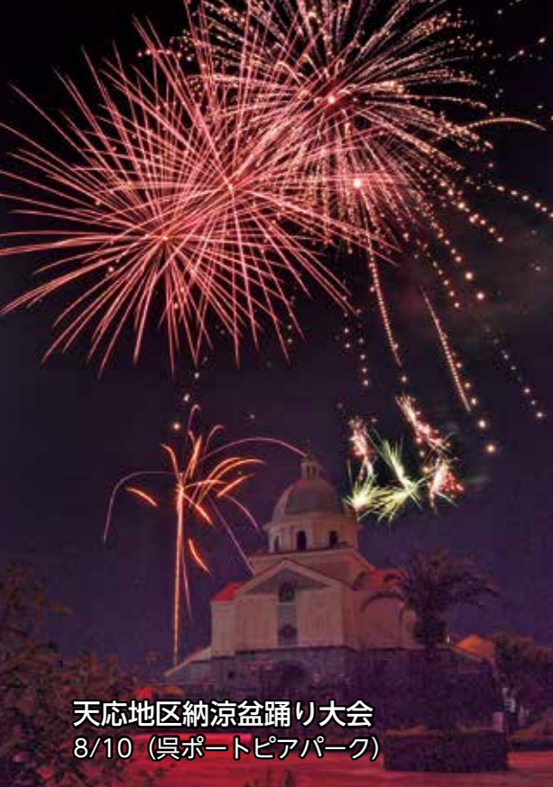
天応地区納涼盆踊り大会 8/10 (呉ポートピアパーク)