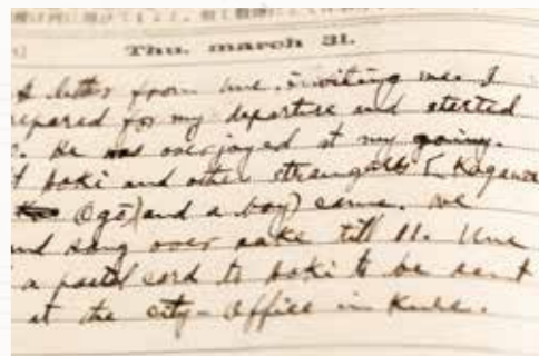
▶中学時代の英語日記 中学生とは思えないほどの 流ちょうな筆記体