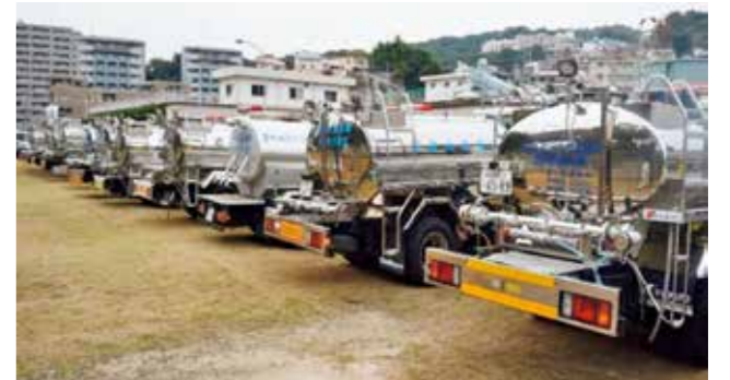
▲日本水道協会広島県支部合同防災訓練に集結した事業者の給水車。災害時に迅速な給水活動ができるよう、近隣市町と連携して訓練を行っています。これらは、さらに自治体間の全国ネットワークによって被災地の支援活動にも生かされています。