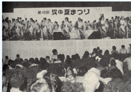
第40回夏まつり (9月号) 中央公園で歌謡ショー・民謡・カラオケ大会などにたくさんの人出でした