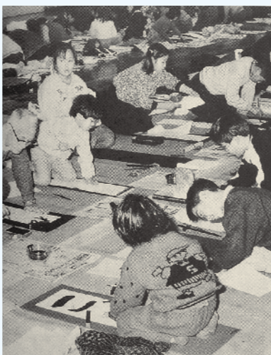
書き初め大会 (1月号) 市体育館で約2,500人が参加し毛筆と硬筆で「たこあげ」「初日の光」などに挑戦