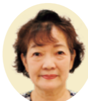
胡中 緑 焼山本庄4丁目