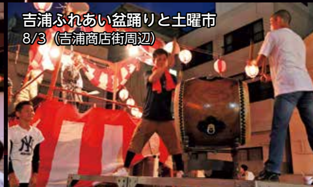
吉浦ふれあい盆踊りと土曜市 8/3 (吉浦商店街周辺)