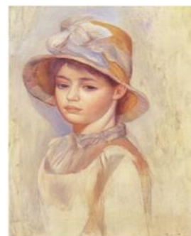
ルノワール「麦わら帽子の少女」1885年