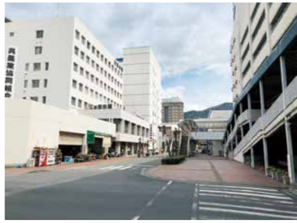
どうなる？呉駅周辺総合開発

近い将来訪れる自動運転社会に迅速に対応できるように次世代モビリティを念頭に置いた駅周辺整備を検討していきます。