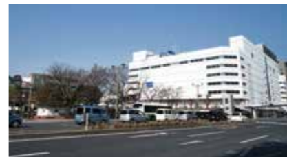
にぎわいの再生を

現在、日本でも有数の専門家などで構成する懇談会から意見や提案を受けている中、呉駅周辺整備には実際に使用する市民の声を聞くことが大事だと思っています。そのため、平成31年度から基本計画を策定するに当たっては、懇談会から