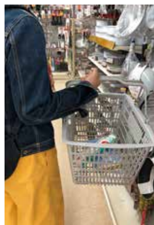
買い物困難者対策を

例えば、安浦地区でスーパーの敷地内に新たなバス停を新設したところ、道路を横断する恐怖感がなくなり安心して買い物に行くことができるようになったという高齢者の声や、バス利用が多くなったとの事業者の声を聞くようになりました。今後新たにバス運行をすることは厳しく、運行中のバスを可能な限り利用していただきたと考えるており、引き続き利便性を高める努力をしていきたいと考えています。