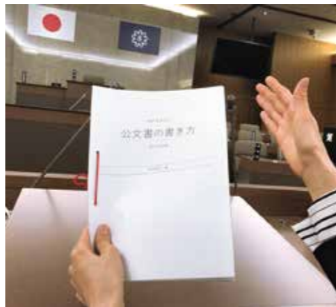
わかりやすい日本語で

公文書は、読む人の立場に立って作成することが必要ですが、外国語や外来語など、いわゆる片仮名語の中には、広く一般的に使われ、既に日本語として定着しているものや、日本語へ言い換えるとかえって理解を妨げるものもあります。公文書の作成に当たっては外来語・外国語を安易に用いることのないようにし、また、用いる場合には注釈を加えるなどして、わかりやすい公文書となるよう努めます。