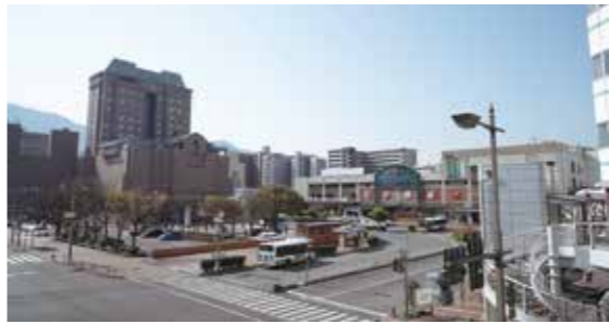
今後のスケジュールは？

市民からも意見を聞きながら、今年度に具体化に向けた基本計画を策定し、できれば来年度の早い時期にプロポーザルなどにより開発事業者を決定したいと考えています。その後、事業計画の策定、基本設計、実施設計などの作業を行い、平成34年度ごろをめぐりに工事に着手したいと考えています。大阪万博が開催される前年まで