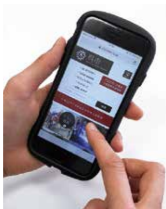
子育て情報をスマホで

子育て支援アプリをダウンロードすると、プッシュ通知機能を使って、予防接種の情報や子どもの成長に合わせた子育て支援情報など、市からの情報を受け取ることが出来ます。また、日記機能や病院、保育所、公園などの子育て支援施設の検索ができるようになり、子育てのさまざまなシーンで有効に活用できると思われるため、アプリを通じて、子育て世代に漏れなく必要な情報を届けていきたいと考えています。