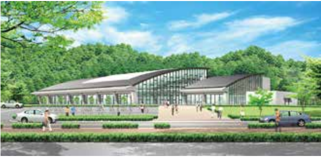
市営プールイメージ図