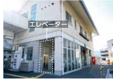
バリアフリー化された新広駅

呉市内の駅で、エレベーター等のバリアフリー化がされていない駅は、呉駅から西に5駅、広駅から東に4駅あります。そのため、未整備の駅では、線路を挟んで海側と山側に集落が分断され、高齢者や乳幼児等を抱えた家族が気楽に利用できる環境になく、拠点整備にとって重要な課題となっています。本来は鉄道事業者が整備すべきことですが、呉市が独自の基準を定めて直接改善していくことはできないでしょうか。