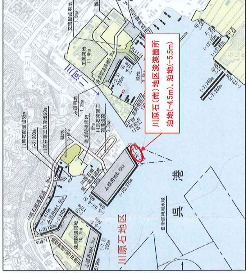
呉港被災箇所(拡大)